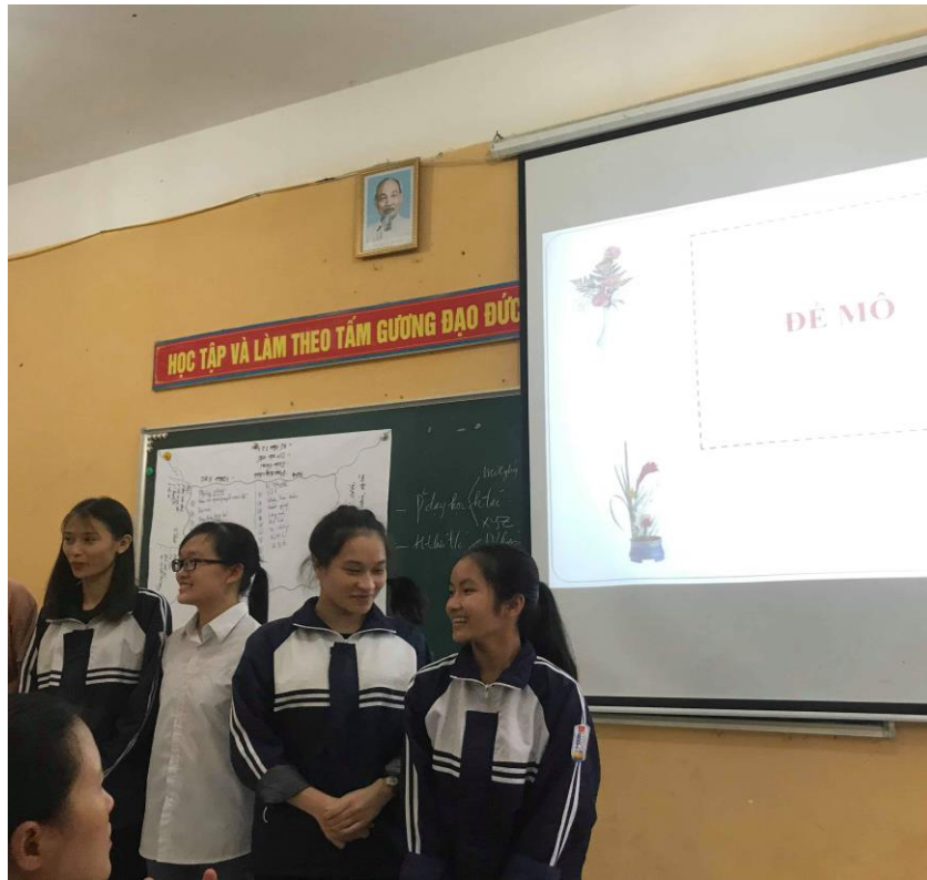
Các em học sinh tham gia làm đề mô (Tiểu phẩm)