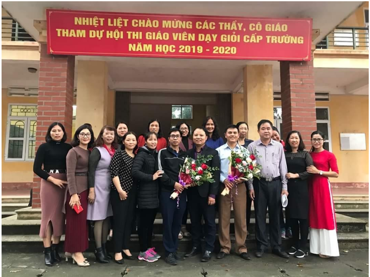
Thầy cô giáo tổ Sử - Địa – GDC tham gia Hội thi giảng GVDG cấp trường Năm học 2019-2020