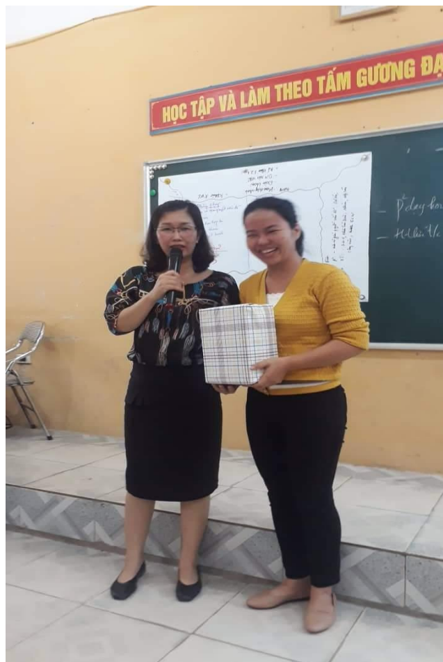
Nhóm giáo viên hoàn thành tốt phần thiết kế các hoạt động dạy học tích cực